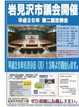
議会開催告知ポスター