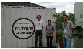
岩見沢に参考となる佐賀市の中心市街地活性化事業の調査