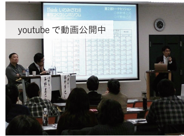
今後の「選ばれる岩見沢」の実現に向けて子育て環境整備の提案を兼ねた会派主催シンポジウムでコーディネーター役