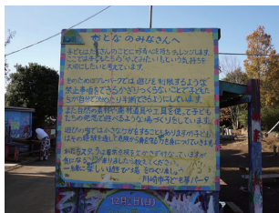
川崎市子ども夢パークの調査。現在の子どもを取り巻く環境を危惧し、親と子どもが健やかに成長する機会をこの岩見沢でもつくり出せるように視察。